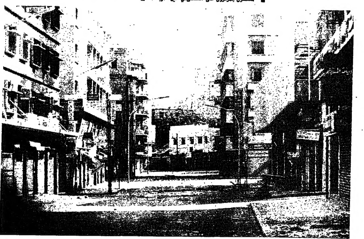
منطقة المزارية خالية من كل حركة